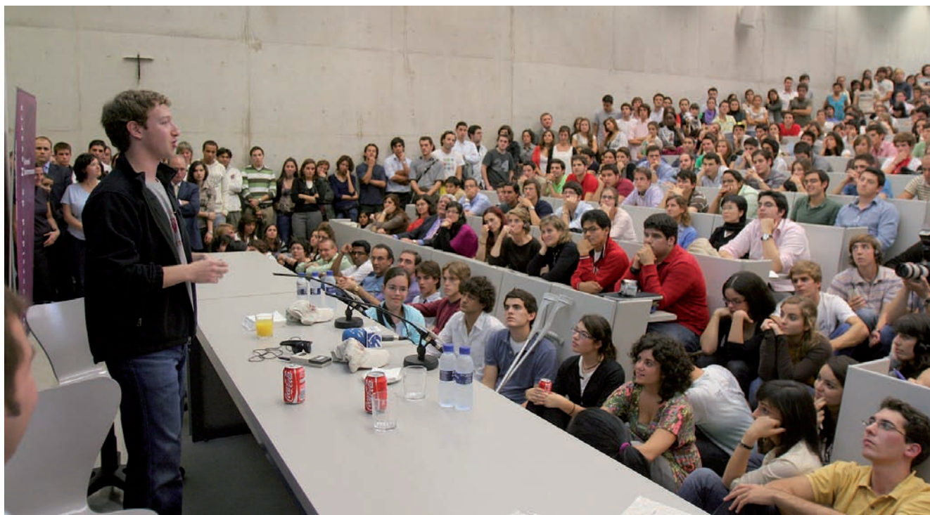
Zuckerberg en un momento de la conferencia

Facebook , al igual que ocurre en la mayor parte de las aplicaciones 2.0, es una eterna versión beta por lo que está constantemente cambiando y rediseñándose.