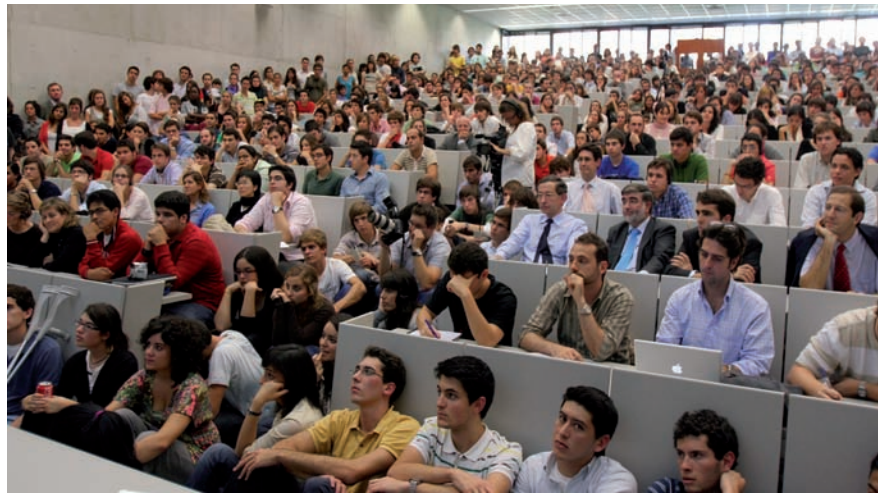
Asistentes al acto

“Esta revista El profesional de la información también ha abierto una sección en Facebook ( http://www.facebook.com/group.php?gid=36050316757 )”