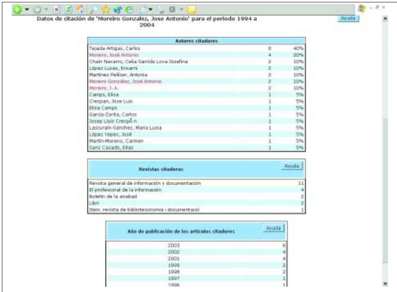
Figura 8. Datos de citación de un autor,

En primer lugar, conviene destacar como, de nuevo, se cumple la distribución asimétrica de las citas entre revistas, tal como apuntara Bradford en los años 30 y repetidamente concluyen todos los estudios bibliométricos que se ocupan de la cuestión. Muy pocas revistas concentran la mayoría de las citas. Así, para todo el período cubierto (1994-2004) sólo tres revistas se llevan el 56% de las citas y seis el 77%, esto es, el 20% de las revistas concentran casi el 80% de las citas. Por contra, el 80% de las revistas no llegan a significar más que el 20% de las citas.