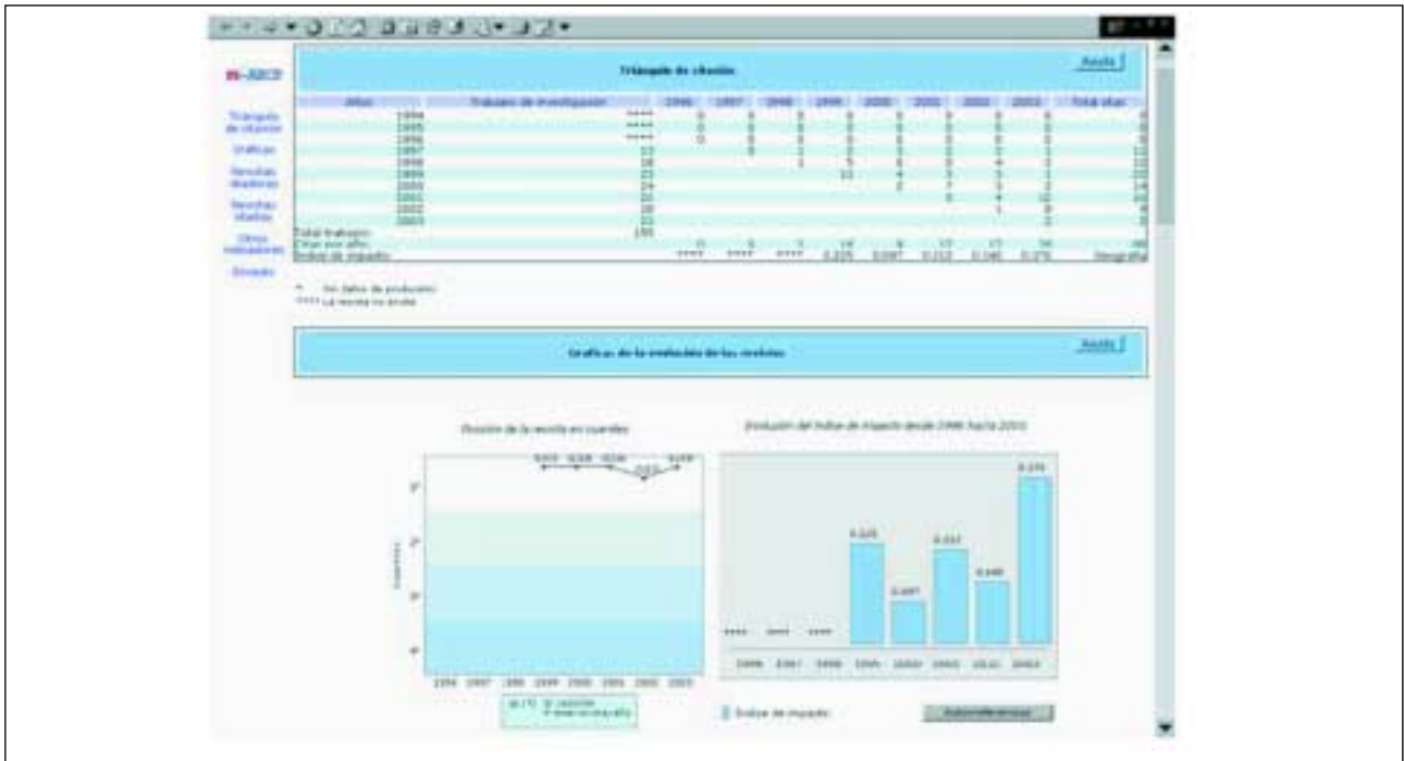
Figura 3. Datos de citación de una revista y evolución del impacto.

apreciaremos como la ven el resto de disciplinas sociales donde la especialidad cobra su pleno sentido.