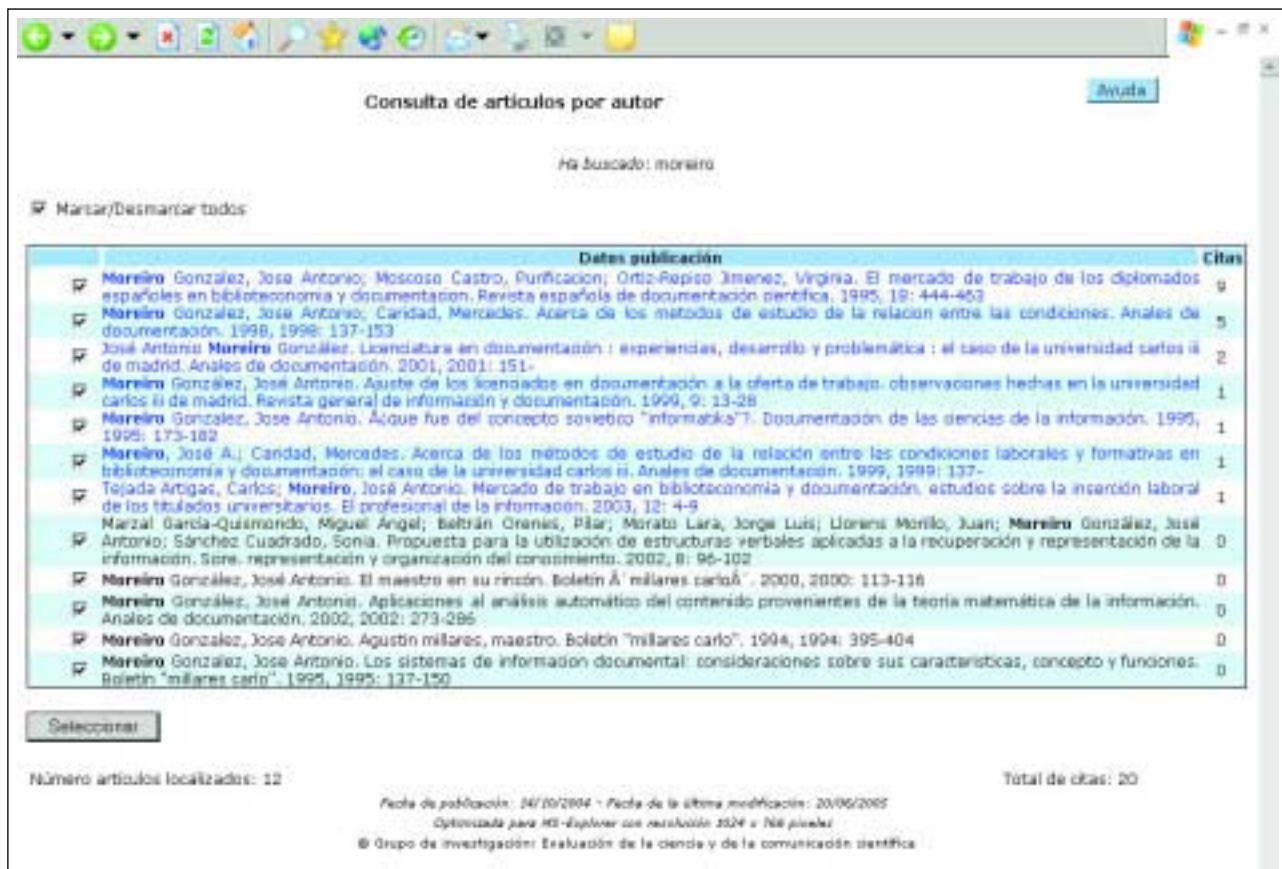
Figura 7. Relación de artículos citados de un autor.

revista, su evolución y su posición respecto al resto de las revistas de la especialidad a través de distintos indicadores bibliométricos, el principal de los cuales es el índice de impacto.