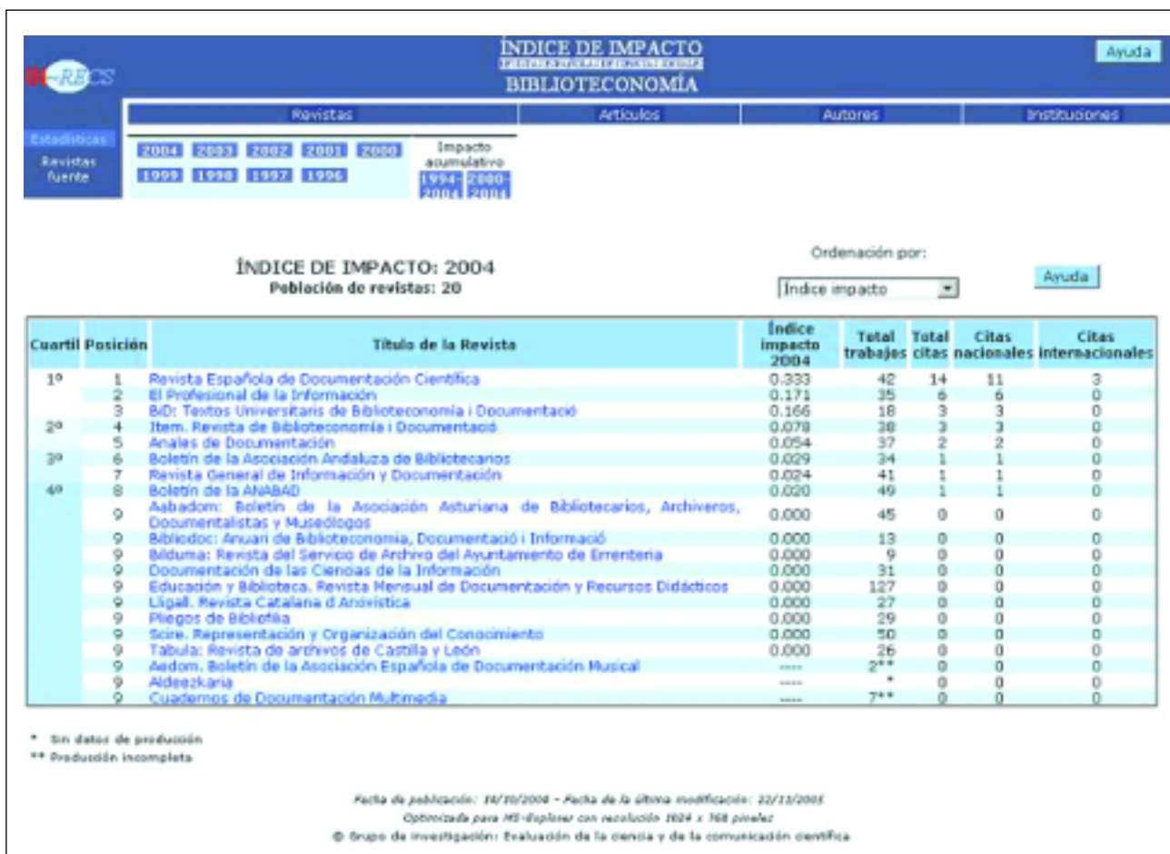
Figura 2. Índice de impacto anual por especialidad

IN-RECS es un índice bibliométrico que ofrece información estadística sobre el impacto científico de las revistas españolas de Ciencias Sociales, calculado a partir del recuento de las citas bibliográficas emitidas por 84 revistas españolas de las siguientes especialidades: biblioteconomía y documentación (6 revistas), economía (19), educación (22), geografía (9), sociología (8), psicología (20). El año próximo, una vez incluidas la antropología, la ciencia política y de la administración, las ciencias de la comunicación y el urbanismo, el índice vaciará más de 100 revistas españolas que abarcarán todas las disciplinas que conforman las ciencias sociales. Quisiera recalcar su carácter multidisciplinar, pues sólo una concepción amplia y abierta como ésta permite calibrar la repercusión y las relaciones que mantienen entre sí las disciplinas de ciencias sociales. De esta manera podremos ver no sólo como una disciplina, como la ByD, se ve así misma sino que